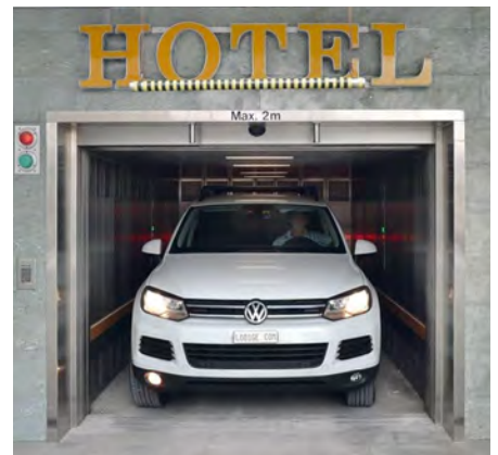
Garage Swissotel - Zürich, Zwitserland