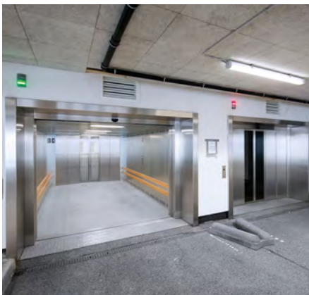
Gemeentehuis - Almelo, Nederland