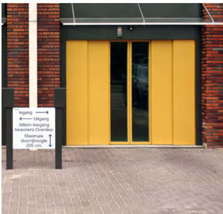
Middenschip - Appingedam, Nederland