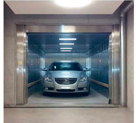
Parking - Zürich, Zwitserland