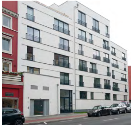
Müggenkampstrasse - Hamburg, Duitsland