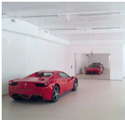
Garage Zenith SA - Sion, Zwitserland